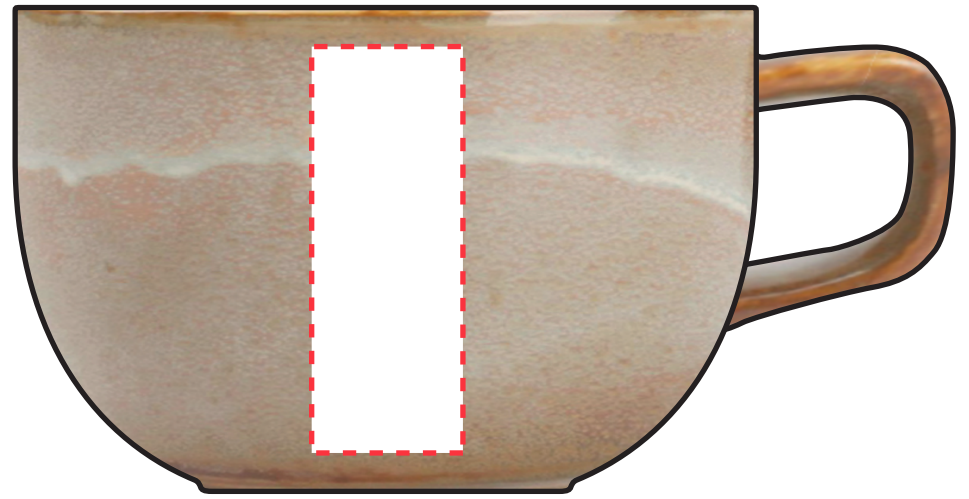
Lengtepositie: 20 x 60 mm