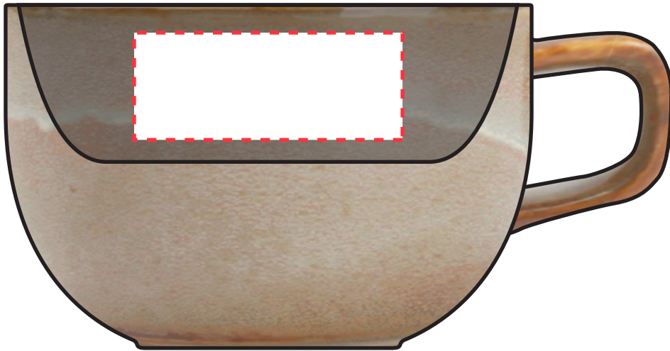
Binnenzijde: 50 x 20 mm