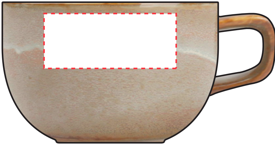
Basispositie: 50 x 35 mm