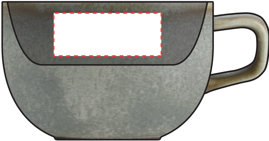
Binnenzijde: 50 x 20 mm