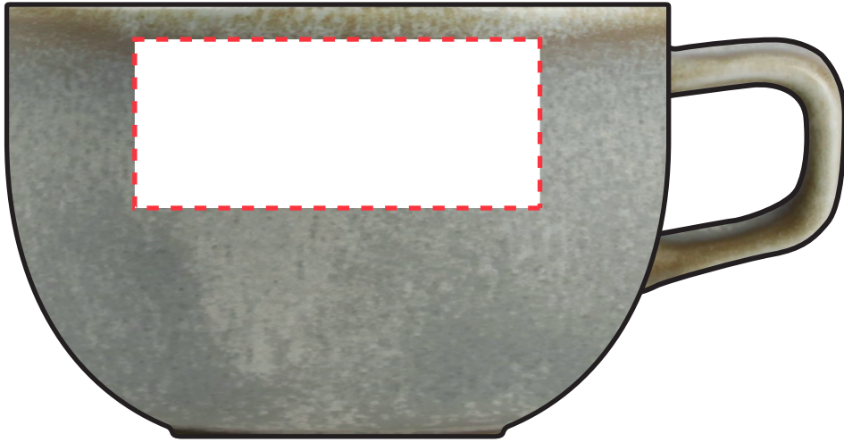
Basispositie: 50 x 35 mm