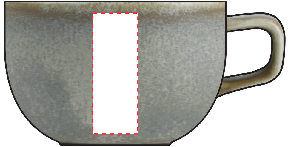
Lengtepositie: 20 x 60 mm